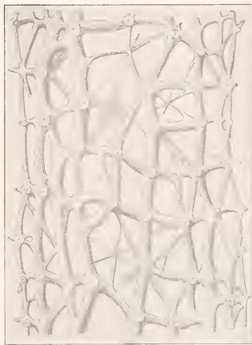
Fig. 1. Ramella tubulosa F. E. SCH. Radiärer Längsschnitt durch das Diktyonalgerüst der Röhrenwand. Vergrößerung 50 : 1.

Der Umstand, daß sich nicht nur zahlreiche, sondern auch recht verschieden gestaltete Repräsentanten dieser polymorphen Species in der „Valdivia“-Ausbeute befinden, hat mich bestimmt, zugleich mit dem hier vorliegenden noch einmal das ganze mir zugängliche ältere Aphrocallistes -Material früherer Expeditionen vergleichend durchzuarbeiten, um einen möglichst großen Ueberblick zu gewinnen.