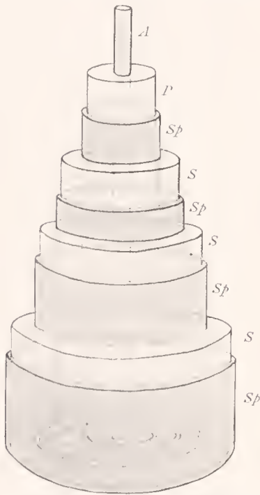
Fig. 3. Schema der Zusammensetzung geschichteter Nadeln aus: Achsenfaden A , Protosiphon P , den Siphonen S und den Spikulinlamellen Sp .

Sodann kann ich zwar der Angabe von CLAUS beistimmen, daß bei allen geschichteten Nadeln die innerste den Achsenfaden unmittelbar umschließende Kiesellage insofern von den übrigen mehr äußerlich gelegenen abweicht, als sie, der Schichtung vollkommen entbehrend, gewöhnlich ein etwas schwächeres Lichtbrechungsvermögen besitzt als die äußeren Lagen und reicher an organischer Substanz ist als jene, kann aber, wie schon oben erwähnt ist, seiner Angabe nicht beipflichten, daß diese von ihm „Achsenzylinder“ genannte innerste Kieselschicht, sich distad allmählich verjüngend, stets bis an die äußersten Strahlenenden der Nadeln reiche und hier die einzige Kieselumlagerung des Achsenfadens darstelle. Uebrigens scheint es mir unzweckmäßig, diese innerste Röhrenschicht des Kieselkörpers der Nadeln „Achsenzylinder“ zu nennen, da sie ja gar nicht in der Achse liegt, vielmehr den Achsenfaden scheidenartig umgibt. Ich werde mich daher hinfort des Ausdruckes Siphon (von dem griechischen σιφών = Röhre) für die Kiesellamellen der Nadelrinde bedienen und diese innerste, oft einzige Lamelle aus später zu entwickelnden Gründen durch die Bezeichnung: Protosiphon auszeichnen.